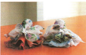
Külaliste kingitus Kurtna koolile - Buraševo õnnenukid